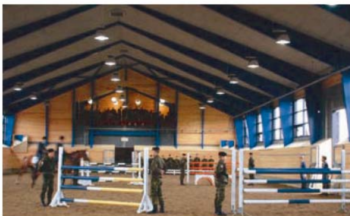
Spring opvisning i det nye ridebus.