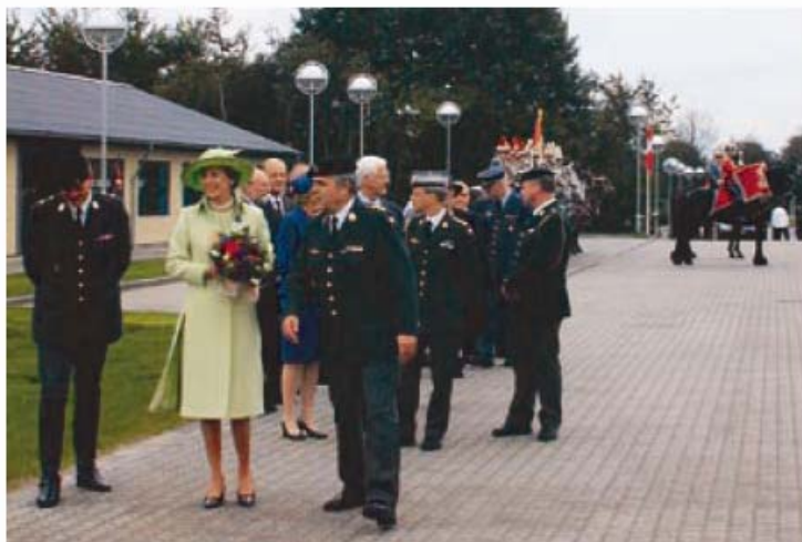
HKH Prinsesse Benedikte samt inviterede gæster.

Foderhuset er sammen med gødningspladsen en funktion der skal anvendes af alle 5 staldafsnit. Det er derfor placeret centralt i anlægget og indeholder udover et rum til oplag af halm et mindre rum for foderblandingsanlæg og fodersiloer.