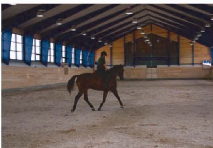
Træning i ridebuset.

at være med til at indvie de flotte nye bygninger, som hun håbede ville blive til stor glæde for både gardehusarerne og deres heste.