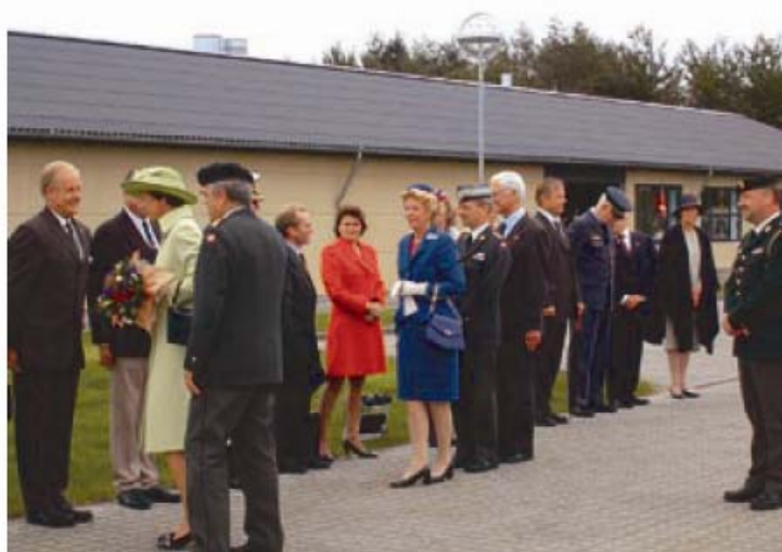
HKH Prinsesse Benedikte hilser på gæsterne.

hvert staldafsnit er indrettet med 15 stk. hestebokse, vandspiltov, solarium og sadelrum placeret om et 5 meter bredt gangareal der bl.a. anvendes som arbejdsareal når hestene skal klargøres. Der er på bygningernes facade mod gårdrummet monteret bindinger således at klargøringen af hestene, når vejrforholdene tillader det, kan udføres udendørs.