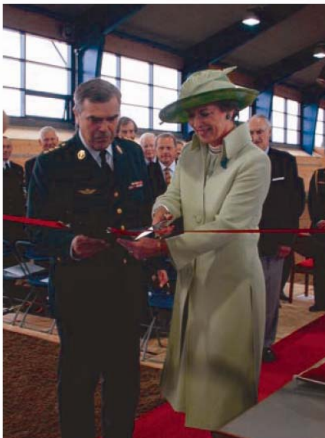
HKH Prinsesse Benedikte klipper snoren.

Projektet blev udsendt i offentlig licitation og i maj 2002 blev der udarbejdet entreprisaftale med firmaet