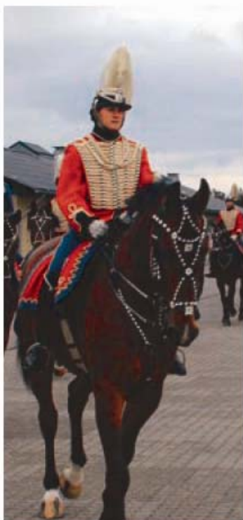
Gardebusarere til best.