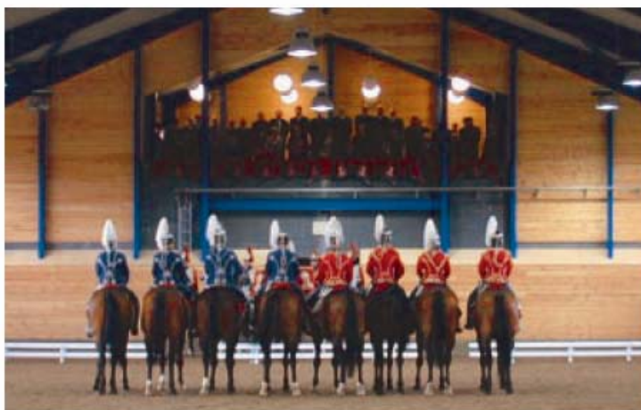
Opvisning i det nye ridebus.