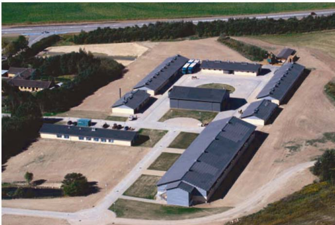
Luftfoto af anlægget.

Inden HKH Prinsesse Benedikte symbolsk klippede snoren til det nye ridehus, udtrykte hun i sin tale glæde over