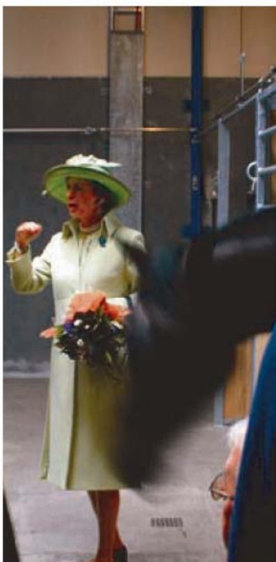
HKH Prinsesse Benedikte besigtiger staldene og blev derefter kørt i karet.