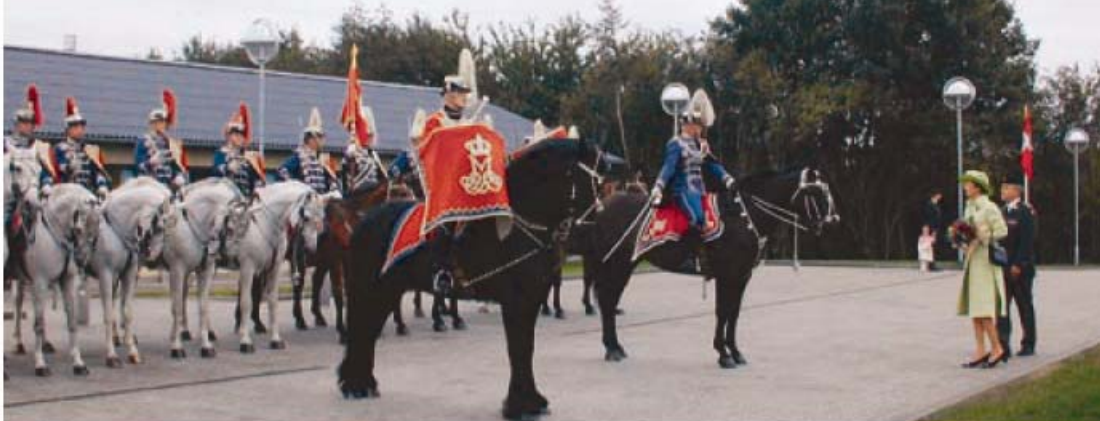
HKH Prinsesse Benedikte hilser på æresgarden.