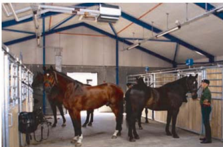
Heste trukket ud til strigling.