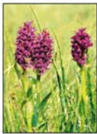
Langs kanten af Movso (3) og ved Rosborg Sø (1) vokser orkidéen Majgøgeurt.

Også uden for vådområderne giver det afvekslende landskab le-vesteder for mange forskellige planter. Særligt lys- og varmekrævende arter som Opret og Nikkende Kobjelde , Tjærnenelike og Skorsøner trives på de tørre, sandede og solrige arealer, og i det lille hedeareal Paradiset (6) vokser en mindre bestand af den sjældne Guldblomme .